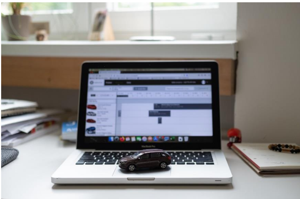
Samoobslužný rezervační systém